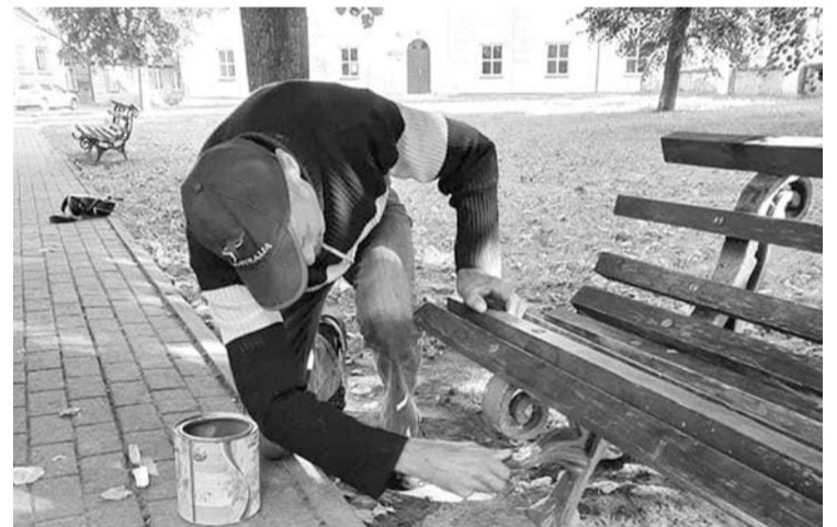
Kainavo tik dažai - pagražinti Troškūnus gyventojai sutiko be atlygio.

įrengtose lentelėse įamžinti vietovardžius arba atmintinas datas.