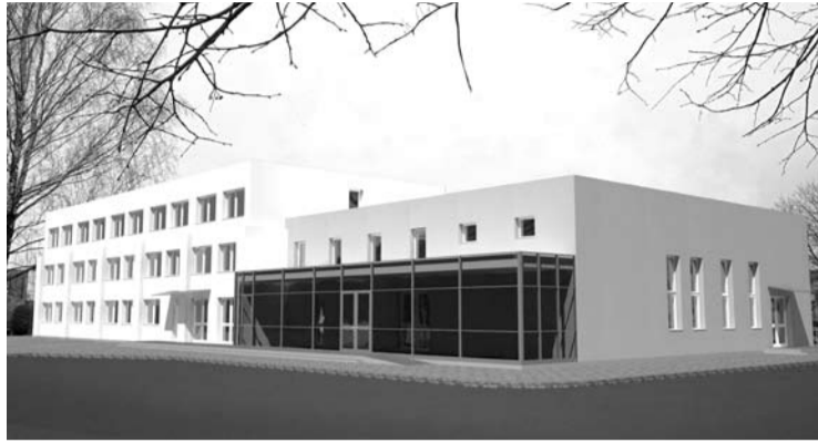
Rekonstruoto buvusio mokyklos bendrabučio vizualizacija.

Globos namai turės savo virtuvę, tačiau ji bus aprūpinta minimalia įranga, nes, kaip skel-