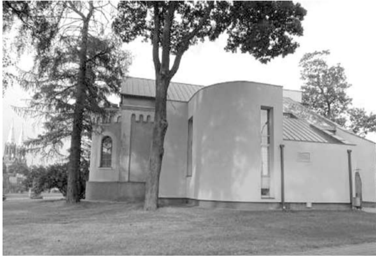
Rangovų pasiūlymų dėl Anykščių koplyčios – Anykščių menų centro teritorijos sutvarkymo savivaldybė dar laukia.

Anykščių rajono savivaldybė paskelbė viešąjį pirkimą senosios Anykščių koplyčios - Anykščių menų centro teritorijai sutvarkyti. Ši teritorija bus aptverta tvora, nors toks projektuotojų pasiūlymas ir sulaukė gyventojų kritikos.