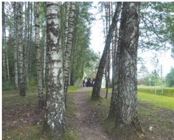
Beržai, augantys pakeliui į „Laimės žiburį“, galbūt mena ir 1965-ųjų metų biliūniečių eiseną.