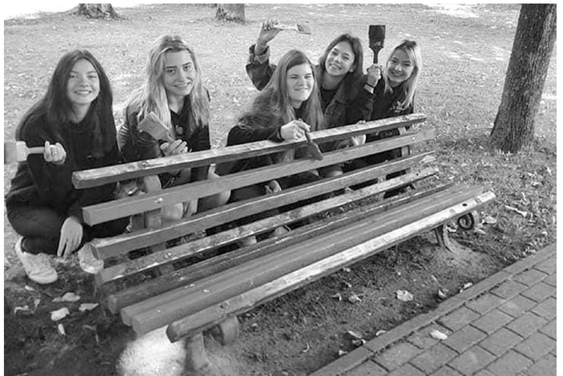
Prie suoliukų atnaujinimo svariai prisidėjo vietos jaunimas.