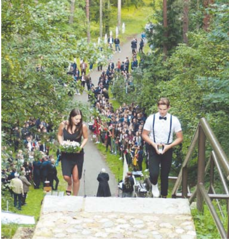
Gėlės ir žvakutė ant rašytojo kapo Rugsėjo 1-ąją - taip pat viena iš biliūniečių tradicijų.

Šimtai J.Biliūno gimnazijos bendruomenės narių nuo mokyklos iki rašytojo kapo Rugsėjo 1-ąją eina kasmet nuo 1965-ųjų.