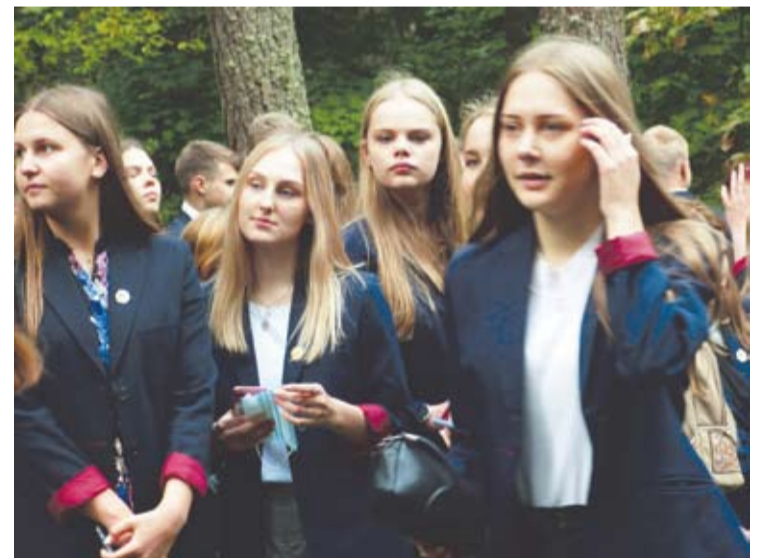
Šiomet J.Biliūno gimnaziją lankys 445 mokiniai.

Pasakoje „Laimės žiburys“ J.Biliūnas rašė apie aukso rai dėmis kalno viršūnėje sušvitusį stebuklingą užrašą „Žmonių laimė“. Seno išminčiaus aiškinimu, tas, kuris įkops į to kalno viršūnę ir ranka palytės užrašą, visus žmones padarys laimingus, bet pats pavirs akmeniu.