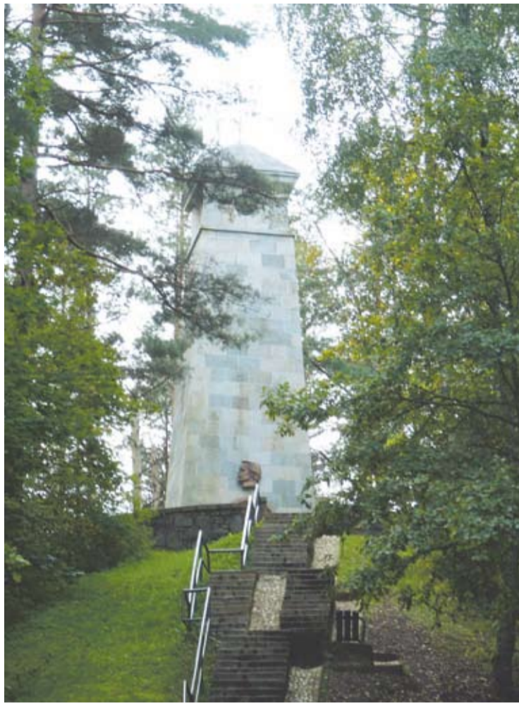
Rašytojo Jono Biliūno palaikai į Anykščius pervežti 1953-aisiais, o 1958-aisiais ant kapo pastatytas paminklas „Laimės žiburys“.

niečių eiseną link „Laimės žiburio“ sakė: „Eitynės - daugiaprasmis ritualas, kuris ne tik suburia visus bendram judesiu, bet kiekvienam eisenos dalyviui tampa ėjimo ir savęs, ir kito link proceso dalimi. Eitynėmis prasidėjusi bendra kelionė į pirmąją pamoką, kai visai šalia junti ore virpantį jaudulį, džiaugsmą, sumišusį su nerimu, matai spindulingas draugų, bendrklasių, mokytojų akis, o pats žvilgsniu keliesi į kalno viršūnę, tampa ir kolektyvine, ir asmenine skrydžio į prasmingesnį buvimą projekcija. Gal dėl to ši Liudiškių kalva kasmet spinduliuoja vis didesnę, raiškesnę aurą, primenančią apie kiekvieno širdyje degantį svajonių žiburį, įsipareigojimą bendruomenei, gyvenimo trapumo pajautą, artumo gimtinei ir grožiui išgyvenimą.“